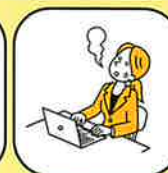
ストレスマネジメント