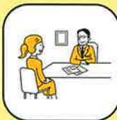
面接シミュレーション