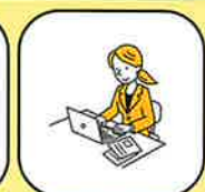
パソコンスキルアップ